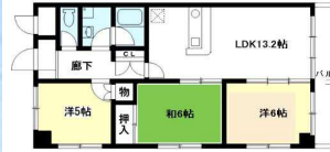
Aタイプ (60.05㎡) LDK13.2×洋6.0×洋5.0×和6.0