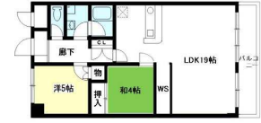
Eタイプ (60.05㎡) LDK19.0×洋6.0×洋5.0×和4.0×WS2.0