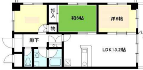
Dタイプ (60.05㎡) LDK13.2×洋6.0×洋5.0×和6.0