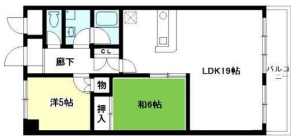
Bタイプ (60.05㎡) LDK19.0×洋5.0×和6.0