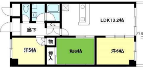
A2タイプ (60.05㎡) LDK13.2×洋6.0×洋5.0×和6.0